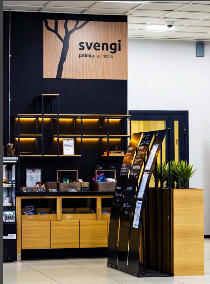
Snack-baari on auki klo 16 asti.