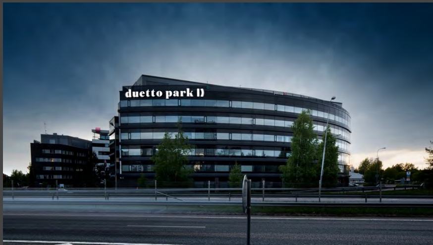
Loistava ja erittäin näkyvä sijainti Tuusulanväylän varrella.