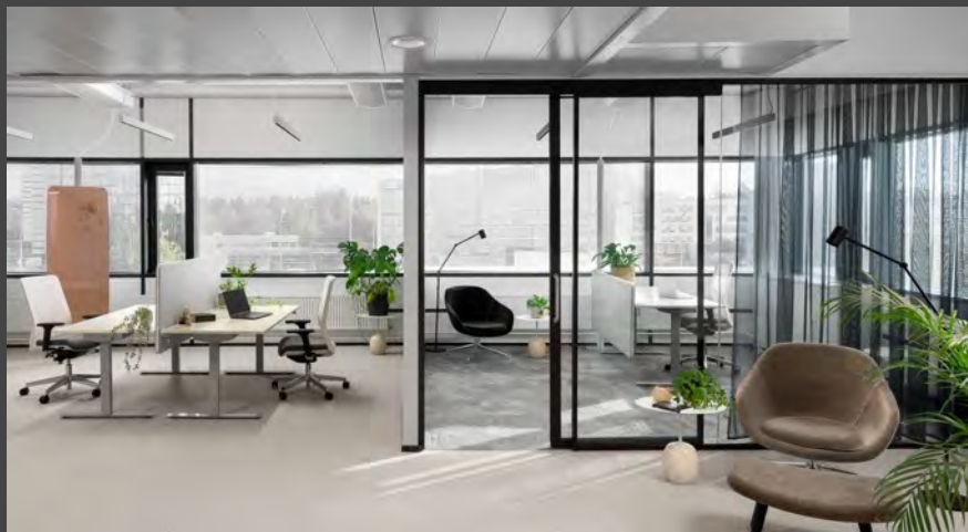
Miellyttävä, vuokralaisen tarpeisiin muokattava työympäristö.