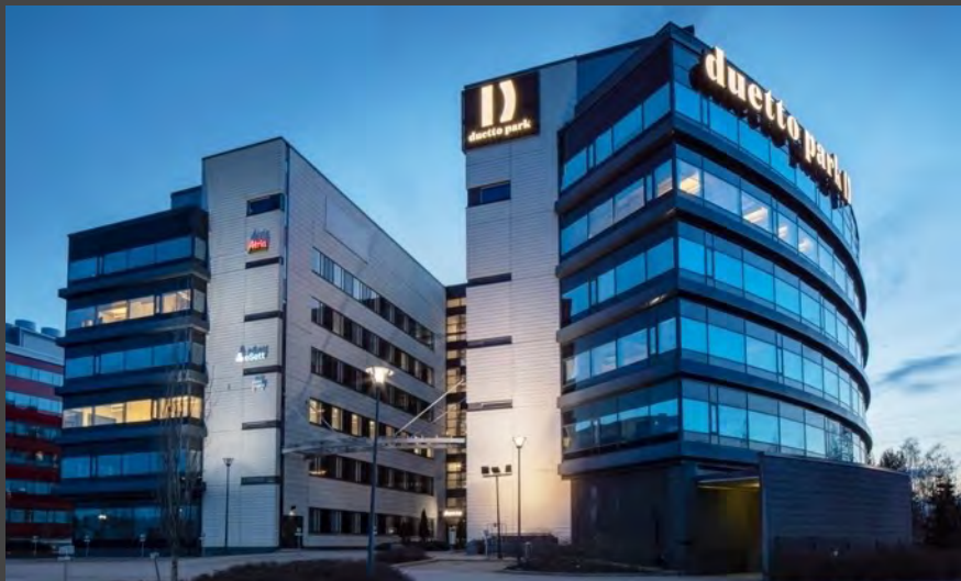
Julkisivun uusitut neon-kyltit lisäävät vuokralaisten ja kiinteistön näkyvyyttä.